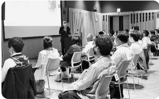
新入会員オリエンテーション 活用事例発表の様子

52事業所・61名が参加した第1部の新入会員オリエンテーションは、当所の活動やサービスをご理解いただき、より積極的にご利用いただくことを目的としています。事務局から事業・サービスの紹介、会員企業から実際の活用事例などのお話をいただいた後、参加企業による自社PRが行われました。