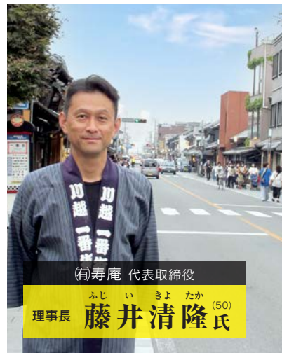
(有)寿庵 代表取締役