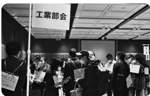
活発に行われた名刺交換

当日は、新型コロナウイルスの感染防止策を講じ、予定していた飲食などは中止となりましたが、参加者からは、「来年も参加したい」、「初めて知った事業があった。紹介されたサービスを利用してみたい」、「本日の出会いがビジネスにつながった」など、手応えを感じた声が多数聞かれました。