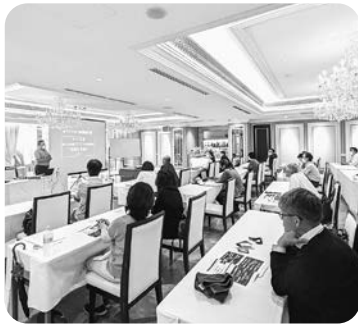
真剣に講義を受ける参加者

9月14日、これから新商品・サービスの提供を予定している方に向けてプレスリリースの書き方や効果的なリリース手法などのノウハウを提供する「第1回プレスリリースセミナー」を開催しました。本事業は今年度から行う新たな取り組みであり、全5回の講義の後、実際に記者の方をお招きし合同記者発表会を開催するというものです。初回のオープンセミナーでは25事業所27名の参加がありました。参加者からの事後のアンケートでは、とても分かりやすい内容でためになった、という感想もいただいています。当所では事業所の広報支援にも力を入れ、今後もお手伝いしてまいります。